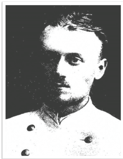
Д.К. Заболотний студент ІНУ в м. Одесі

Д.К. Заболотний потрапив тільки у 1898 році. У той час Данило Кирилович був уже відомим ученим. У лабораторіях Пастерівського інституту він проводив експерименти з чуми і прослухав курс лекцій з мікробіологічної техніки [4].